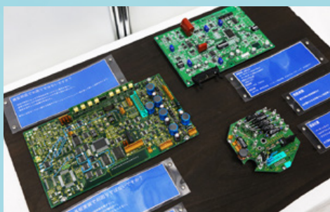
回路設計や基板のニーズに幅広く対応