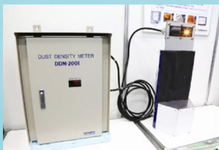
自社製品のダスト濃度計

当社は、プリント基板はもとより、電子機器・ソフトウェア・機器筐体の設計・製造を通じて幅広いOEM製品を手がけており、なかでも放射線測定器には半世紀以上のノウハウがある会社です。シビアな精密さを求められる放射線測定器製造で鍛えた技術を活かして、半導体の検査設備や自社製品のダスト濃度計（煙突からの煤塵くばいじん）の連続測定）へと事業領域を広げてきています。特に、アルミ溶解炉を持つ工場では、当社ダスト濃度計を制御に組み込むことで集じん機ブロワの回転数をばいじん濃度が高い時だけに最大にすることで、電気代が20%削減されたデータもあり、現代のキーワードとなる“脱炭素”に貢献するアイテムとして使われています。また国内の火力発電所や高炉製鉄所をはじめ海外工場にも採用されるなど、市場をリードする存在です。保守点検までトータルなサービスを提供しています。