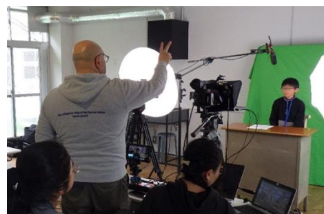
緊急地震速報の原稿読みを体験