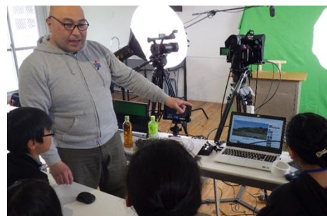
撮影は事前の段取りが重要！