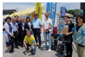
区長・区議長から激励訪問をいただきました